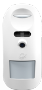
FOTO ON DEMAND